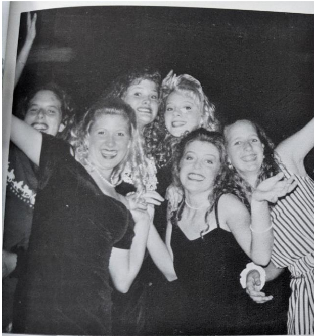
Junior girls smile during their break from dancing.