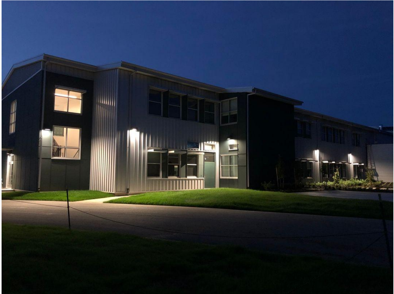
North Marion High School lights up a dark night.

$300 per month and sessions are four half days a week. To sign up to have a Registration Packet mailed to you in March, use this link: Preschool Registration Packet Request .