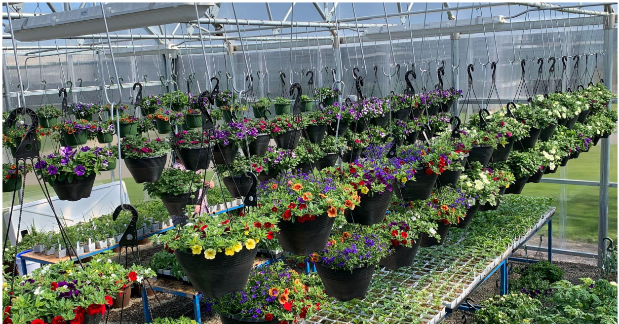
Bursts of petunias and calibrachoa fill the pots in the High School greenhouse.

Read the full story on the North Marion School District website .