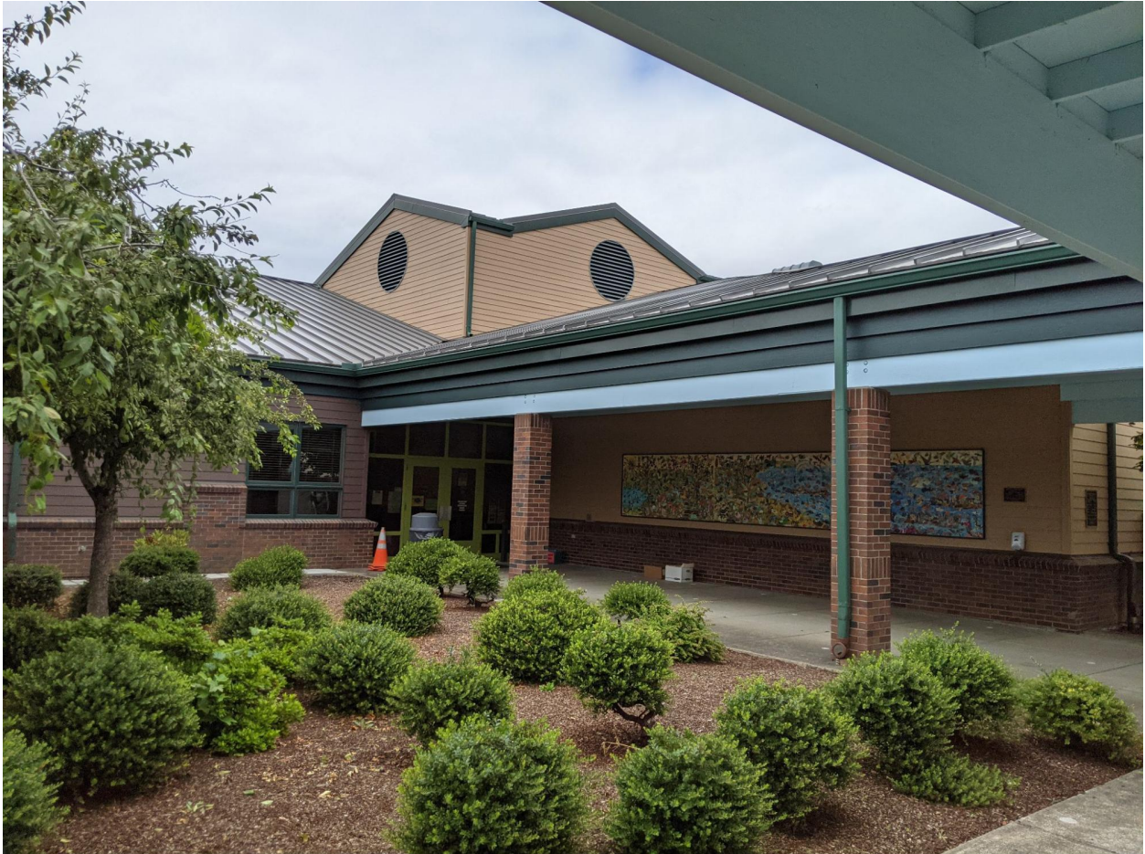
Imagen de la escuela primaria en 2021