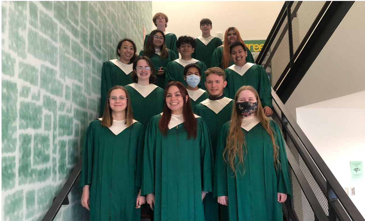
The North Marion High School choir stands in formation for a Yearbook photo.