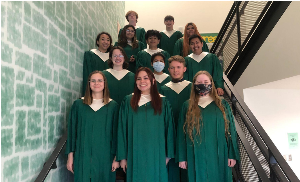
El coro de la escuela Secundaria North Marion se coloca en formación para la foto del Anuario.