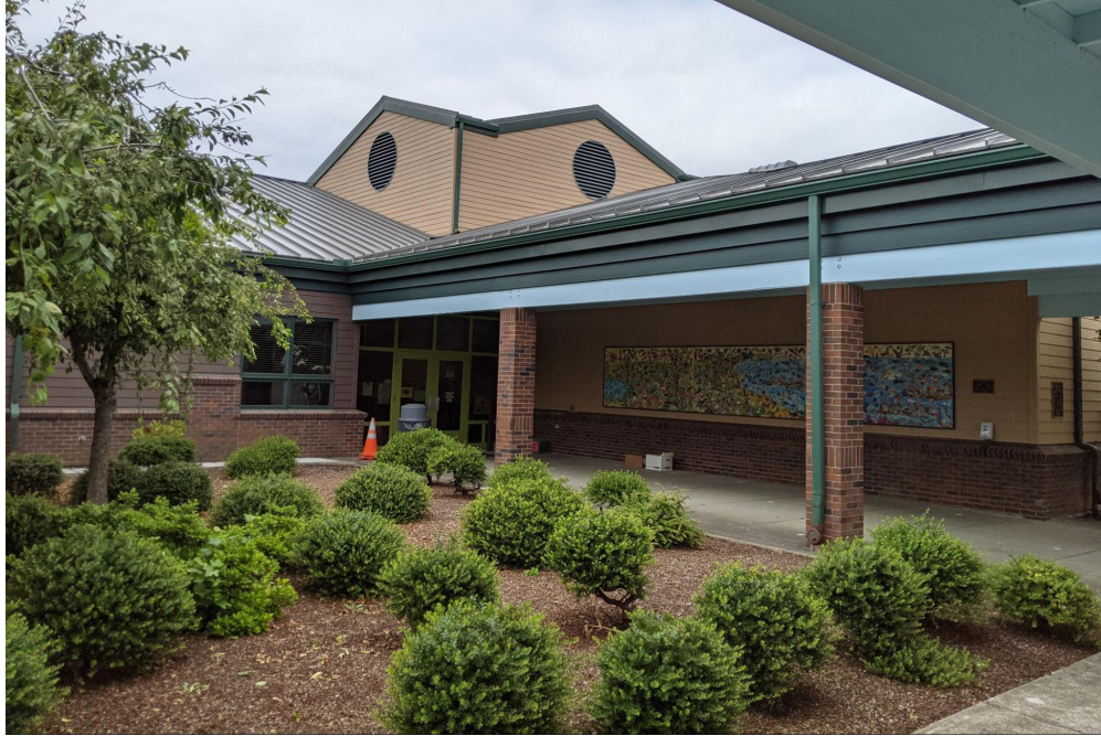
Image of the Primary School in 2021