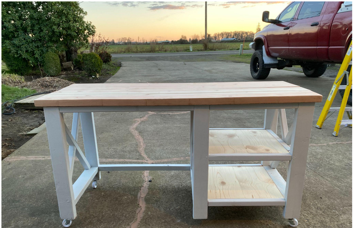
Above is the desk that Tyler Rooper crafted on her own, complete with finely wrought detail and a handy set of wheels.